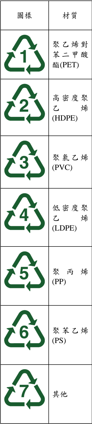
附圖二：塑膠材質回收辨識碼圖樣