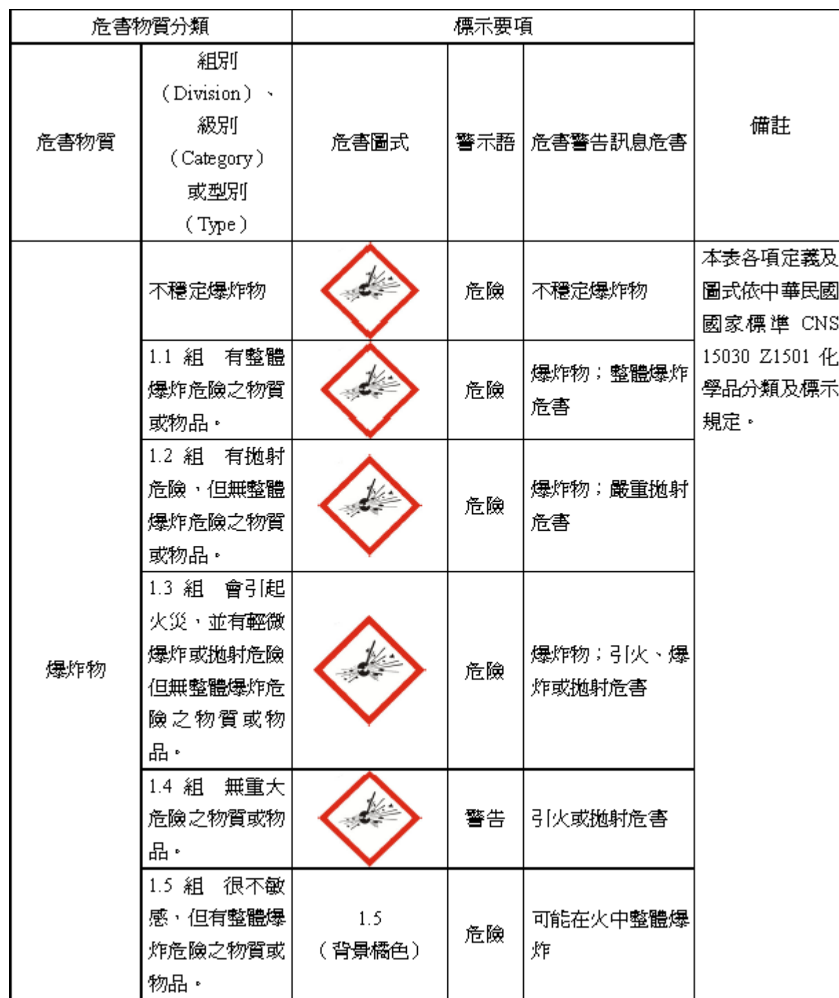
危害物質之分類、標示要項