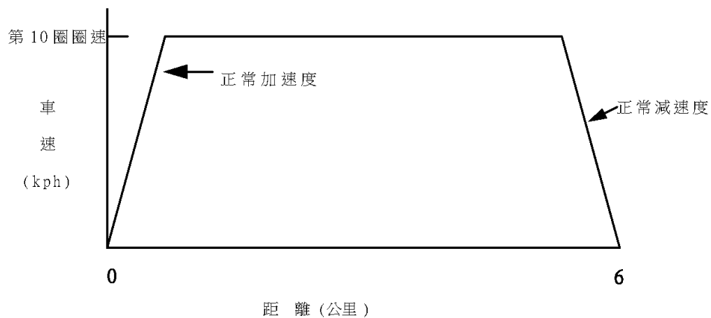
圖 2、第 10 圈行駛方式圖