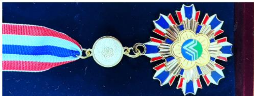
三等環境保護獎章