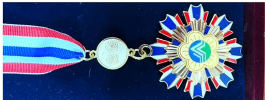
二等環境保護獎章