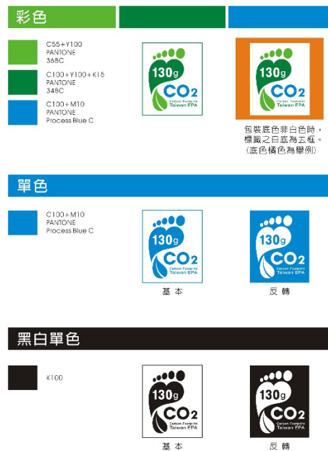
附圖二 標籤使用圖例