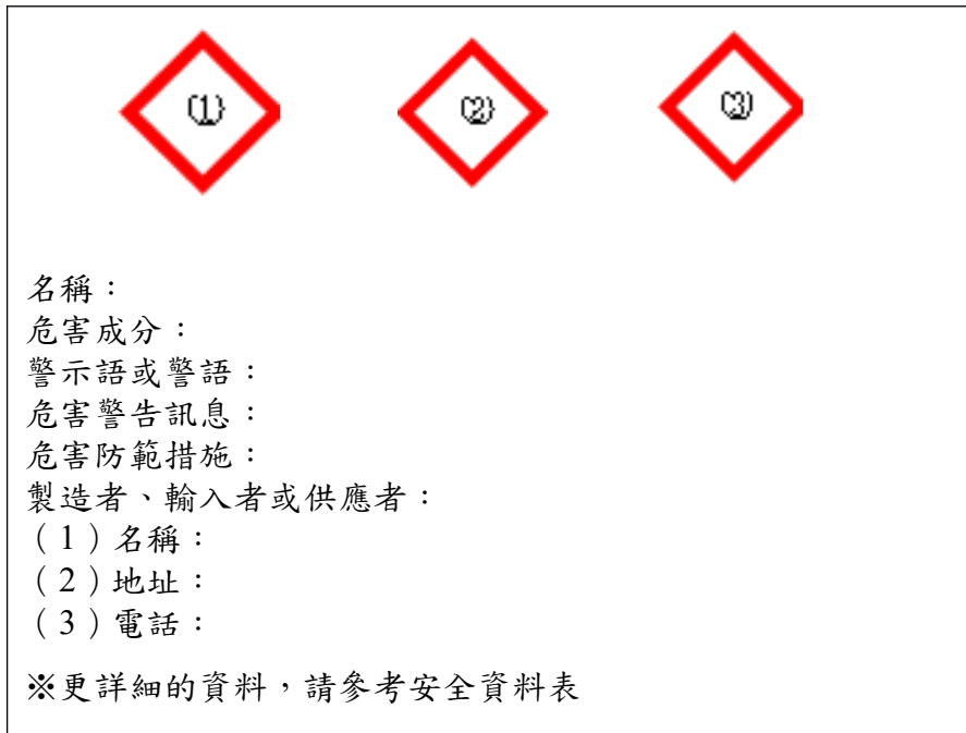
附表 容器、包裝標示之格式