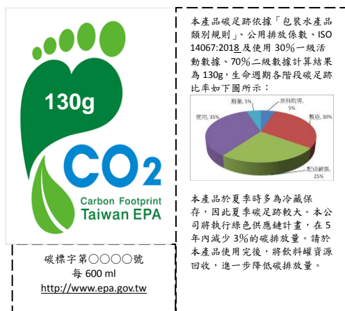
圖一 產品碳足跡標籤標示範例